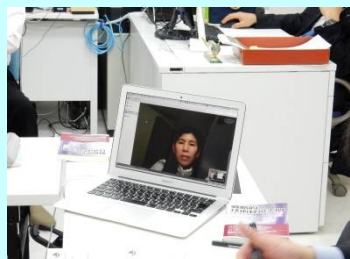
ネットで講義に参加