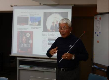
米シリコンバレー・エンジェル投資家、平強顧問による講演