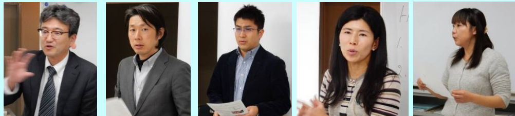
演習で報告する受講生(3期生)